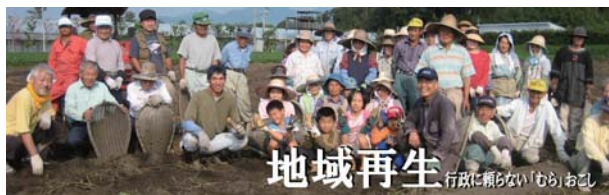
地域再生 行政に頼らないむらおこし