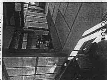
②-1 上がり煙改修 (手すり)