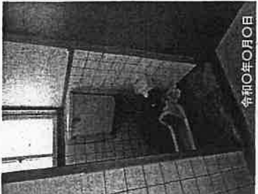
①-1 トイレ改修 (手すり)