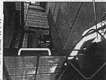
②-1 上がり煙改修 (手すり)