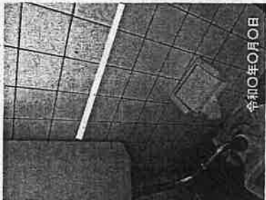
①-2 トイレ改修 (手すり)