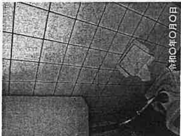
①-2 トイレ改修 (手すり)