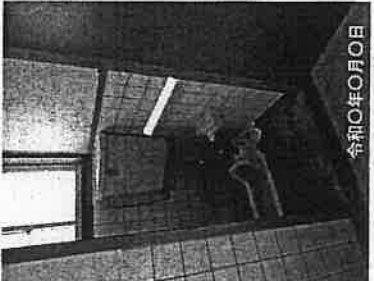
①-1 トイレ改修 (手すり)