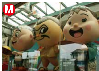
ごめん・なはり線あかおか駅。キャラクターはえきさんさん。ここには各駅のやなせさんのキャラクターが全員並んでいます。