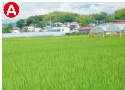
広い田園風景を眺めながら歩くと、春には田んぼの中に住む小さな生き物に出会えます。