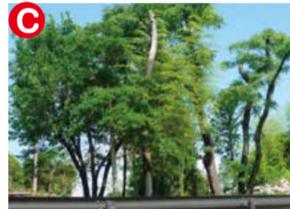
「その木を切らないで」と、不要な庭木を集め、木々の歴史を引き継ぎ森を作る技研の「記念の森プロジェクト」。