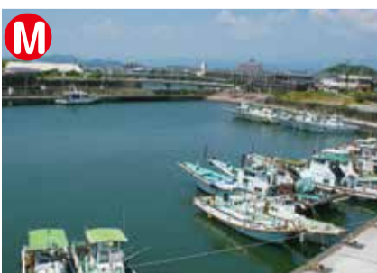
赤岡漁港。どろめ漁の釣り船は、毎日この港に戻ってきます。隣の赤岡海岸では、毎年「どろめ祭り」が開催されます。