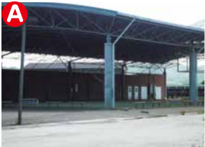
毎年相撲大会が行われている赤岡ドーム。スタート地点です。ここからコースに入っていきます。@15台駐車可能。