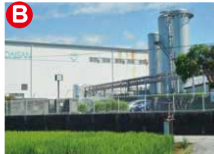
1920年(大正9年)から高知で綿の製造をおこなう「大三製綿所」として創業。レトロ看板「ニコホン」は同社のもの。