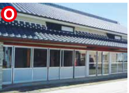
赤岡町の本町通り。絵金祭りでは屏風絵が並び通り。7月14.15日の宵宮祭りでは、夜店が出ないので、静かに絵を見られます。