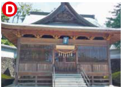
須留田八幡宮。赤岡にある絵金の絵のうち18点はここに奉納されたもの。幕末より屏風絵が展示されていました。