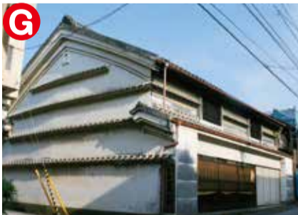
赤岡橋を渡ると横町商店街。4層の水切り瓦の美しい土蔵造りが現れます。山城屋という元商家。現在は歯医者さん。