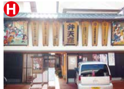
元は農協の倉庫。絵金祭りでは、絵金歌舞伎が上演されており、まちの人たちの要望により昔ながらの芝居小屋として復活。