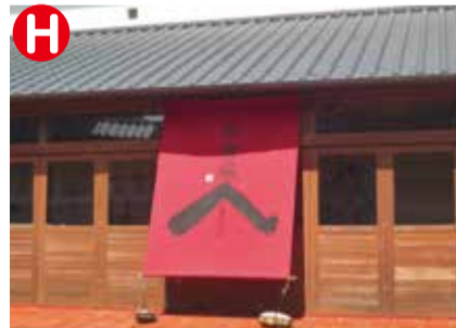
町民所蔵の屏風絵を保管するために、まちの人たちの活動により建設された絵金蔵。美術館としてレプリカが見られます。