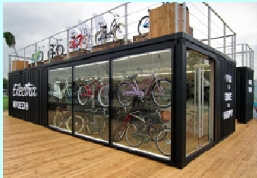
レンタサイクル施設イメージ （2階は無し予定）

レンタサイクル利用者の更なる増加を目指すために、「道の駅やす」に レンタサイクルのサテライト施設を整備 し、一般のサイクリストだけでなく観光サイクリングを目的とした利用者の利便性を向上させることにより（車や電車で訪れても気軽にサイクリングを楽しめる）、市内の飲食店や観光施設への周遊の促進を図る。