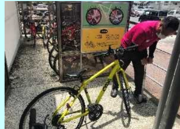
レンタルイメージ