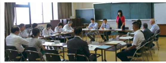
市人生支援計画策定委員会は、民間委員11人、市職員6人で構成。

また、この計画は毎年見直しを行い、時代に合った市民ニーズに対応できるよう協議、検討を重ねていきます。