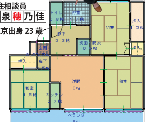
香南市営住宅「ハビネスかがみ」間取り図