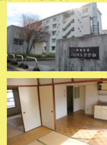
間取り4.5畳、6畳、6畳、DK6畳、バス、トイレ