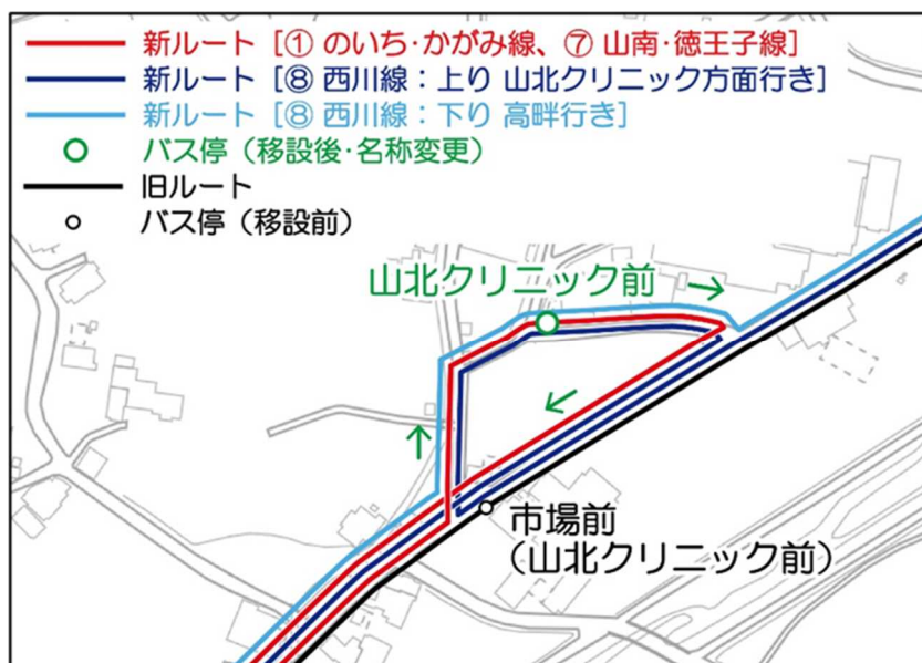
図：山北クリニック前（現市場前）バス停における運行経路

これまでに市場前バス停を利用している人の多くが山北クリニックに通院する人がであったため、直接山北クリニックに乗り付けられるよう要望が出され、現地調査の結果、運行が可能と判断した。