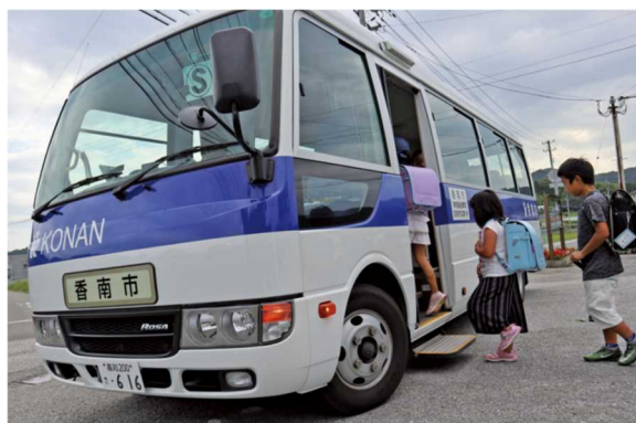
写真：スクールバス乗車の様子