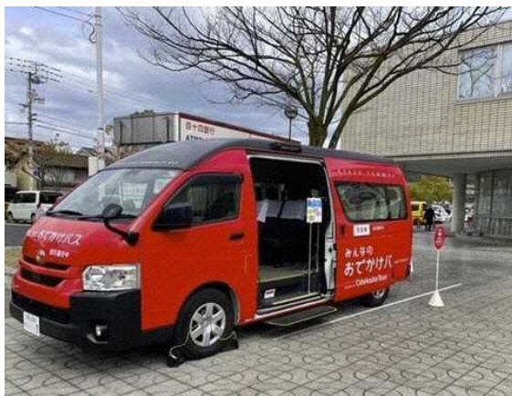
例：みんなのおでかけバス（香川県宇多津町）

市営バス車両の前方席を一部改造し、手押し車やベビーカー、輪行バックなどを置けるフリースペースを整備する。手押し車やベビーカーをバスに積載する際の運転手の手助け等にあたっては、他自治体等を参考にしながら、運行の安全を確保した上での運用を検討する。（※導入時期は R6 年度を予定）