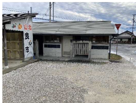
市場前（待合場所の裏）