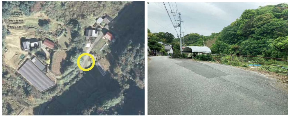
⑭ 日の出団地ゴミステーション