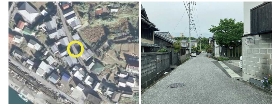
㉔ 住吉通りゴミステーション