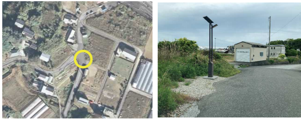
⑳ 手結山消防団屯所前