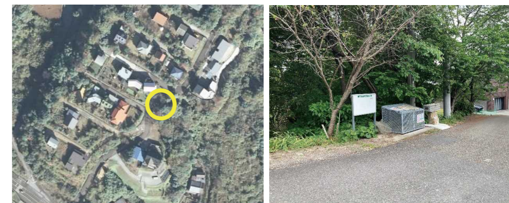
⑩ 中谷団地ゴミステーション