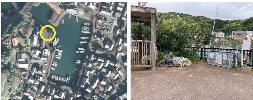
④ 手結港西ゴミステーション