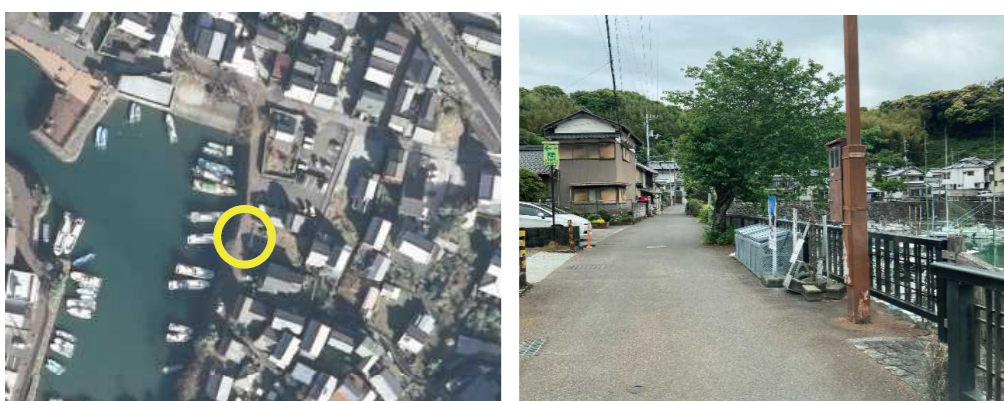
③ 手結港東ゴミステーション