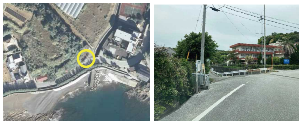
⑦ サイクリングターミナル前