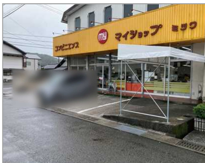
③ マイショップミツワ