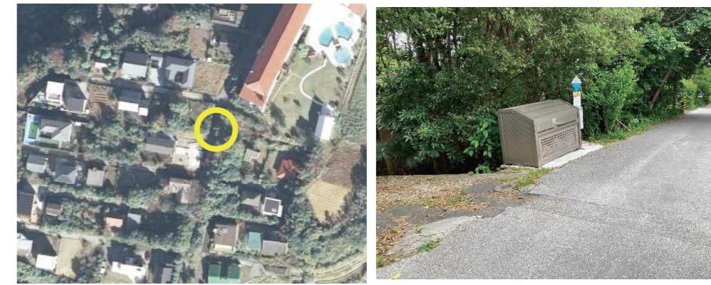
⑨ 手結山団地ゴミステーション