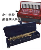
小中学校楽器購入事業

香我美町にある2つの集落活動センターで活動する集落支援員をご紹介します ■地域支援課 ☎57-8503