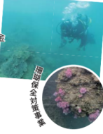
西川地区集落活動センター 水産資源管理事業