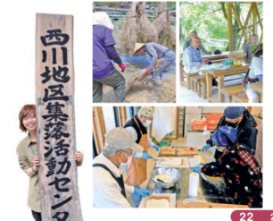
西川地区集落活動センター