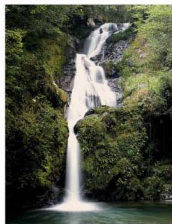
後楽河川敷にある落差20mの「大瀬の滝」