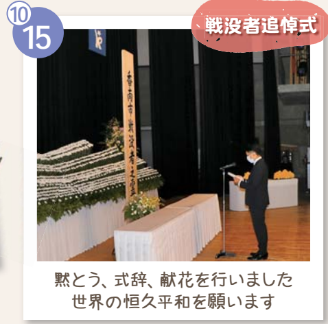
黙とう、式辞、献花を行いました 世界の恒久平和を願います