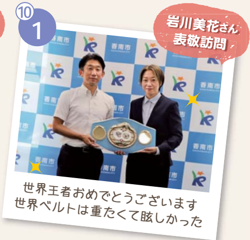
世界王者おめでとうございます 世界ベルトは重たくて眩しかった