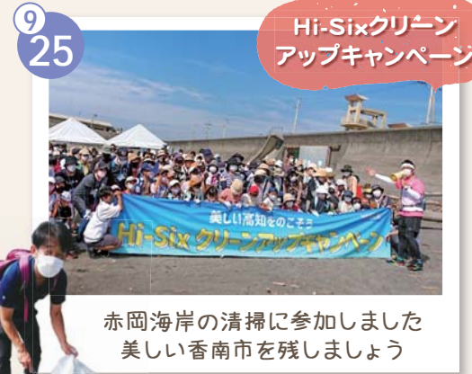
赤岡海岸の清掃に参加しました 美しい香南市を残しましょう

スポーツの秋。皆さんはどんなスポーツをされていますか。 2023龍馬マラソンの開催も決まって私もエントリーを行い、最近練習を開始しました。姿を見かけたらぜひ声をかけてくださいね。