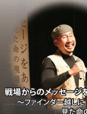
渡部陽一 戦場カメラマン/フォトジャーナリスト わたなへ よいち