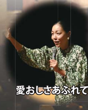
映画監督 安藤桃子 あんどう ももこ