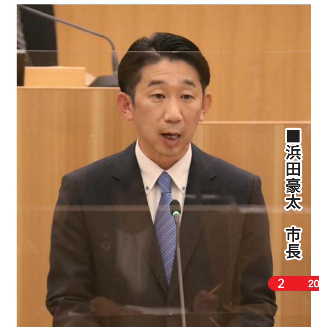
■ 浜田豪太 市長