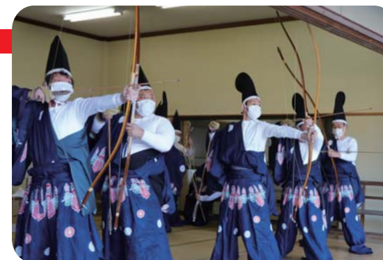
▲二日間延々と射芸が続きます

1月21・22日(土・日)、百手祭が夜須八幡宮で行われました。二日間で約1200本の矢を放つ百手祭。高知県三大弓行事の一つで、香南市無形民俗文化財にも指定されており、五穀豊穰や家内安全などを願い弓を射ます。 射手は立烏帽子や長袴、素襦を身に着け、六人ずつ交互に矢を放ちます。 的に狙いを定めた射手の矢は、冬のひんやり冷たい空気を切り裂きます。夜須八幡宮には、乾いた矢の音が響き渡っていました。