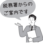
税務署からのご案内です

混雑緩和のため、確定申告会場(南国税務署)への入場には入場できる時間帯が指定された入場整理券が必要です。