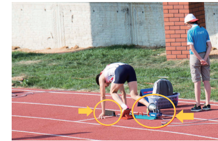
▲光るランプでスタートを知らせます