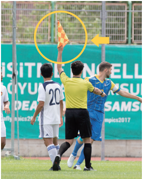
▲サッカー競技では旗を使用