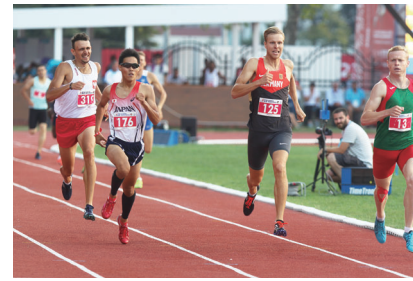
▲第23回夏季デフリンピック競技大会 サムスン2017