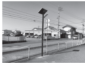
▲野市中央病院前駐車場のソーラー式避難誘導灯

今回の寄贈により、安全で確実な避難行動や医療救護活動が可能になるとともに、夜間訓練などにも効果を発揮し、防災力の向上が図れることとなりました。