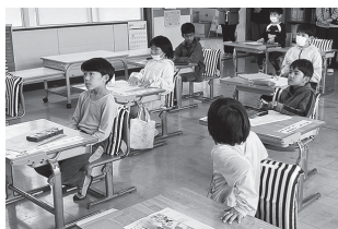
▲吉川小学校での使用風景