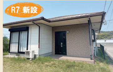
▲夜須町坪井のお試し滞在住宅