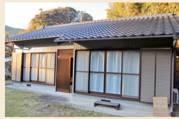
▲香我美町西川のお試し滞在住宅