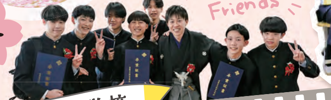
Thank you! Friends