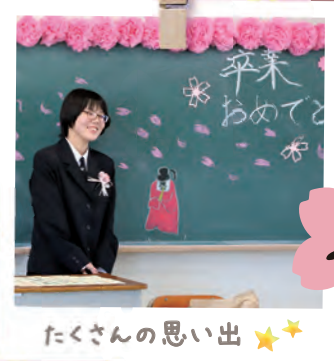
たくさんの思い出