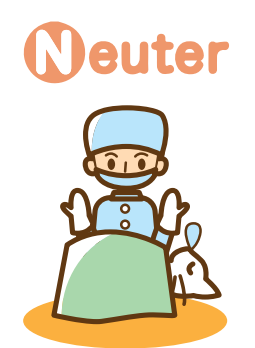
Neuter 不妊・去勢手術する