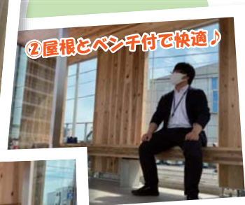
②屋根とベンチ付で快適！