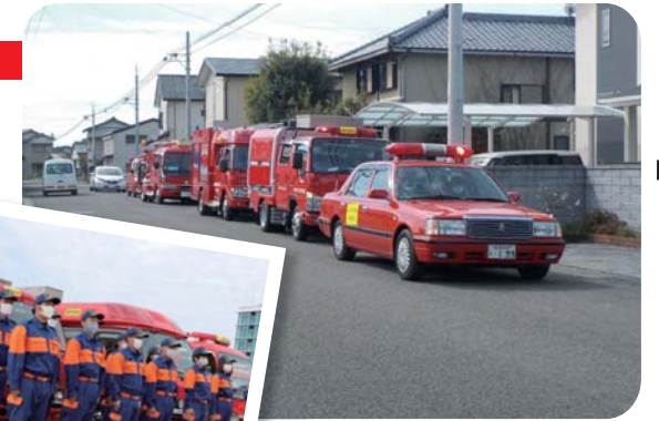
▲消防車で巡回し、火災予防の呼びかけを行いました

また水止め前には、河川の自然水利が使用できなくなることから、消火栓や防火水槽など消防水利の点検も行いました。