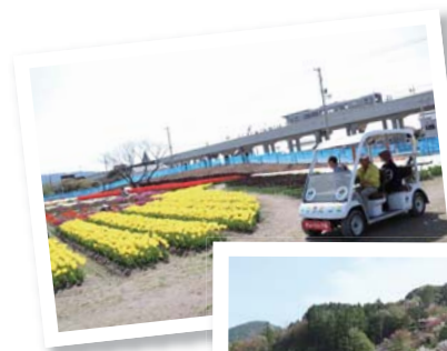
▲かがみ花フェスタ チューリップまつり

西川花祭りでは、会場となる西川花公園一面に菜の花や花桃、桜などが咲き誇りました。多くの来場者が訪れ、満開の花と春の香りを楽しんでいました。