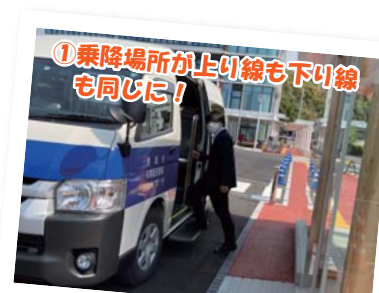
①乗降場所が上り線も下り線も同じに！