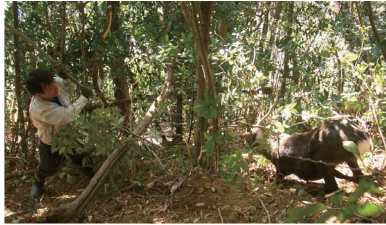
※地域おこし協力隊の任期は3年間