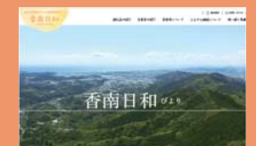
▲香南日和ホームページ

香南市のHPに掲載している特設サイトです。香南市直営で運営しているため、寄附額がより有効活用されています。事業者様の情報も満載ですので、ぜひ、市外の方へもサイト紹介をお願いします。