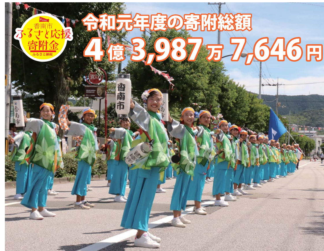
▲香南市こどもよさこいにもふるさと納税は活用されました