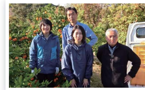
▲みかん農家受け入れの様子