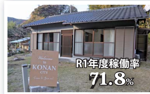
▲西川地区にある“お試し滞在住宅「西川」”