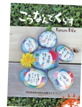
▲香南市移住促進パンフレット

平成28年度より「ウェルカム移住・定住促進事業」として、移住相談員の配置や空き家バンク制度の導入など、さまざまな取り組みを展開してきました。