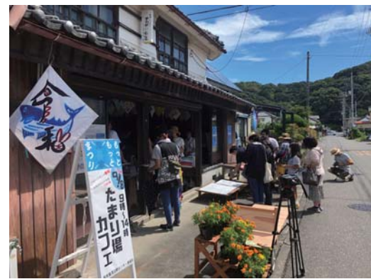
▲空き家を活用した古民家カフェ「かつばや」