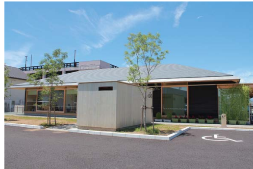
▲総合子育て支援センター「にこなん」

■これまで、お子さんを預かる場所は原則、まかせて会員さんの自宅でしたが、令和2年4月より総合子育て支援センター「にこなん」や、のいちふれあいセンター内にある「にこにこルーム」も利用が可能になりました。(※各施設の開館時間内に限ります)