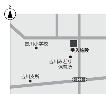
吉川地域一時保管施設 (吉川みどり保育所北側)

野市町西佐古一般廃棄物処分場(粗大ごみ受入施設)については、覆土工事等のため、令和2年3月から当面の間、受入を中止します。中止期間中は吉川地域一時保管施設にて受入を行います。受入日・受入時間等詳しくは挟み込みのカレンダーをご覧ください。