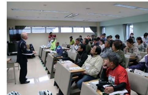
道路交通法・交通ルールや視覚障害者について学びます

昨年度より一般公道の走行が解禁されたタンデム自転車。乗り方やルールを知らないと実は走行が難しい自転車です。今回は、東部自動車学校で、そんなルールから乗り方までそれぞれ専門の講師の方にお話していただきます。「道路を走るときに気をつけないといけない事って何?」「身内に視覚障害の方がいて一緒に乗りたいけれど...」そんな悩みや疑問を一発で解決します! 走行についてはMaze-Cleが、しっかりとサポートします!