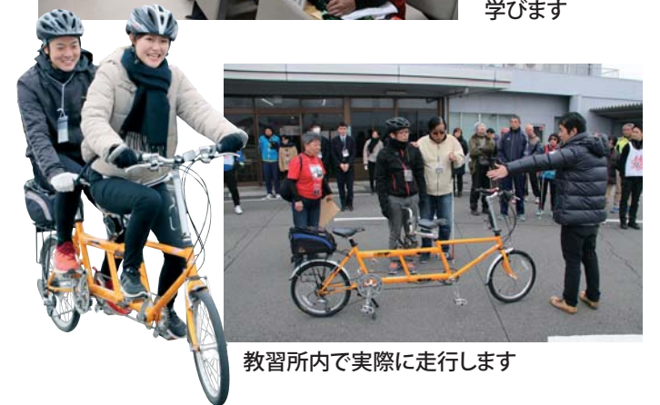
教習所内で実際に走行します