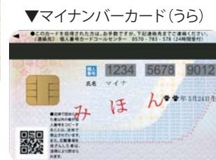
▼マイナンバーカード(うら)