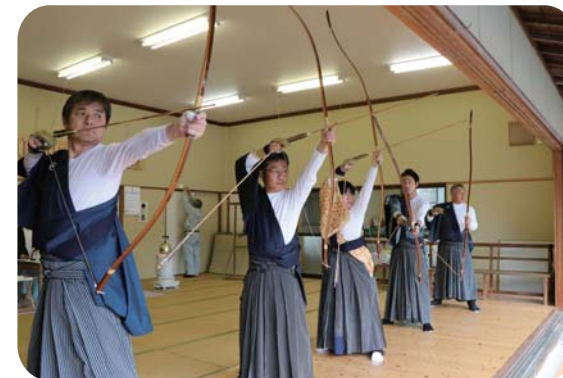
▲心静かに狙いを定めて

射手は氏子の12人。五穀豊穰や家内安全などを願って、28メートル先にある的に2日間で約1,800本の矢を放ちました。的に矢が当たり太鼓が打ち鳴らされると、見学に訪れていた夜須小学校の児童や幼稚園児からも拍手と歓声が上がりました。また、実際に用いた弓に触らせてもらったりと、貴重な体験となりました。