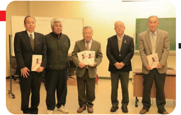
▲これからも地域のために!

令和元年12月19日(木)香南市商工会より香南市内の福祉施設(児童施設 愛童園、障害福祉施設 土佐あけぼの会)2カ所および香南市社会福祉協議会が運営しているこども食堂(こども食堂コトコト、やすまるちよっこりくん)2カ所の計4カ所に寄付金が寄贈されました。この寄付金は、商工会主催の香南市民ゴルフ大会～チャリティゴルフコンペ～でのチャリティイベントやオークションでの収益金となっています。地域活性化を願い、これからも取り組んでいきたいと話されていました。