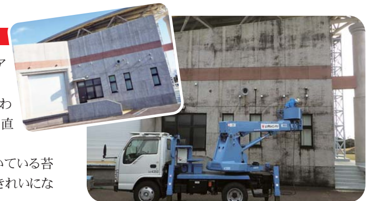
▲高い所の汚れも、すっかりきれいになりました!

当日は、高所作業車や高圧洗浄機を使い、外壁についている苔や汚れを1カ所ずつ、丁寧に清掃すると、見違えるようにきれいになり、利用者の方が気持ちよく利用できるようになりました。