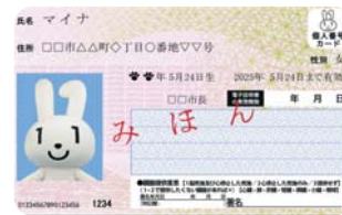
▲マイナンバーカード(おもて)

まだ、マイナンバーカードを持っていない方は、便利なコンビニ交付を利用するために、マイナンバーカードの申し込みをしてみませんか?お気軽にお問い合わせください。