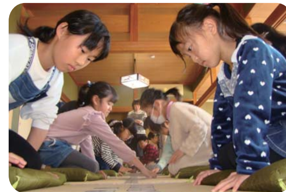
▲集中力を高め、札を取り合いました

参加者は、1対1で向かい合い、ピリッと張り詰めた空気の中、身を乗り出し、上の札が詠まれると、「はいっ!」と声を響かせ、札を取り合いました。