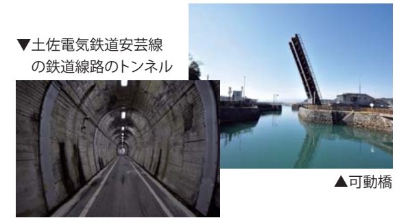
▼土佐電気鉄道安芸線の鉄道線路のトンネル