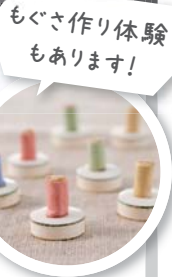
もぐもぐ作り体験もあります！