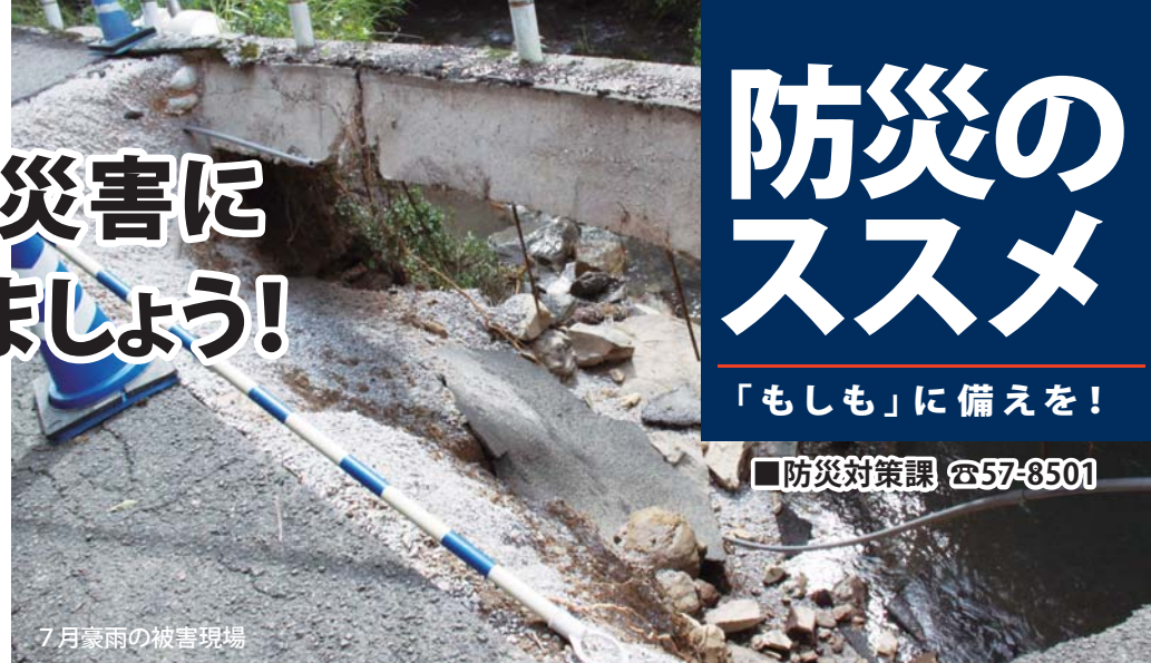
7月豪雨の被害現場

今年は豪雨による被害が発生し、土砂崩れや浸水被害が多発しました。今後も台風の接近により、大雨や洪水の危険性が高まります。水害や土砂災害に対する事前の備えをしっかりとっておきましょう。