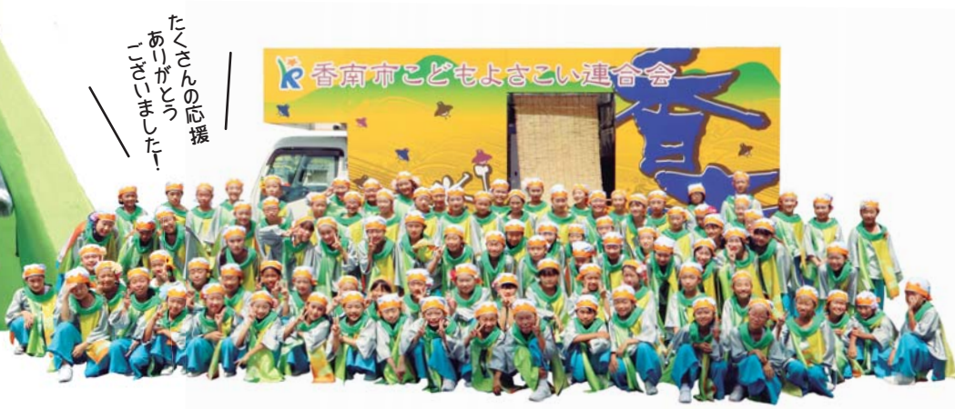
皆さんの応援ありがとうございました!