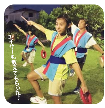
エイサーも教えてもらった!

2日目は、首里城へ。みんな沖縄独特の建物に興味津々。琉球王国の歴史について学びました。その後、ビーチで海水浴を楽しみました。青く透き通る海、珊瑚のかけらが転がる真っ白な砂浜に、あらためて沖繩を実感しました。 最終日は、八重瀬町の友達に おすすめを教えてもらいながら、お土産を購入。お別れセレモニーでは、貴重な体験と、新しい友達ができたとへの感謝の言葉がそれぞれから発表され、帰高の途へつきました。