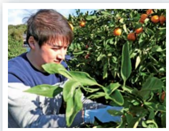
▲ワーキングホリデーを活用して みかんの収穫を手伝う体験者