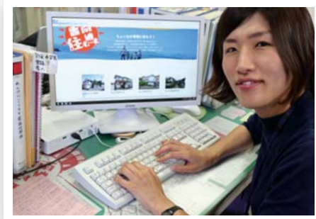
▲市HP「香南住む〜ず 移住応援ガイド」で紹介