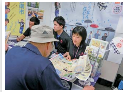
▲農林課とともに大阪での移住フェアへ参加

平成28年度より、地域支援課に移住相談窓口をもうけ、移住専門相談員を配置。東京や大阪で定期的 に開催される「移住相談会」にも参加し、各課と連 携しながら市のアピールを積極的に行っています。 ※関連記事23ページ