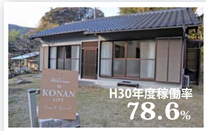
▲西川地区にある「お試し滞在住宅「西川」」

将来的に香南市への移住を考えている方を対象と した、1カ月単位(最長3カ月)で利用可能なお試し 滞在住宅を平成29年12月に整備。地域の方と交流 しながら移住への不安を解消していただく施設と して、今後も利用促進に取り組んでいきます。 ※利用者のうち2組3人が市へ移住されました