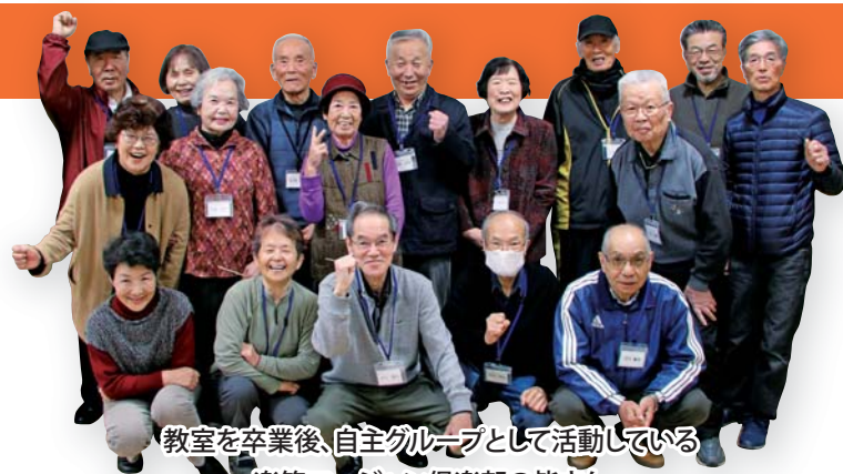
教室を卒業後、自主グループとして活動している楽笑マージャン倶楽部の皆さん