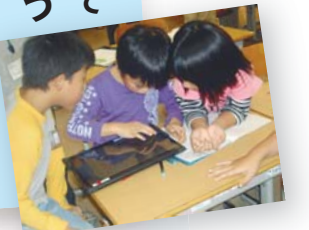
ICT=Information and Communication Technologyの略

ICTとは情報通信技術のこと。この技術の飛躍的な進化によって、インターネットやAI(人工知能)、ロボットなどが今よりもっと身近になってくるのが予想されている未来を子どもたちは生きていきます。今のうちからは生きていきます。今のうちからは生きていきます。今のうちからは生きていきます。