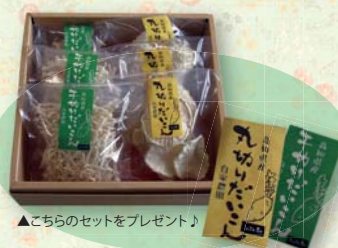
▲こちらのセットをプレゼント!

自家農園で栽培した野菜を加工した乾燥野菜。定番の干切だいこんに加え、丸切だいこんは手切りで厚みをしっかり残し食べ応えのある食感に仕上げました。もちろん無添加で自然の味が楽しめます。お鍋の具材や浅漬け、キムチなどアイデア次第でいろんな料理にアレンジできます。商品は、こんこん屋(香南くろしお園)のほか、高知県内のエースワン・エマックス及びサンシャイン各店舗で販売中!!