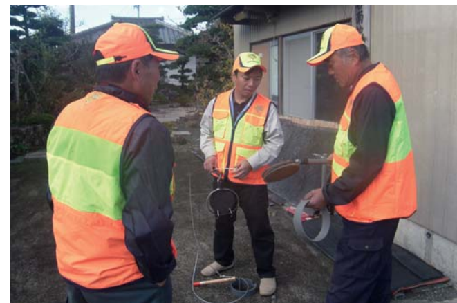
▲香南地区猟友会の方から罾の仕掛け方を教わりました

被害対策のひとつとして、鳥獣対策用の柵で農地を囲う方法があります。イノシシやシカの侵入可能経路を特定し、適切な場所に柵を設置し、農作物に被害が出ないようにします。ただ、柵を設置する場所を見分けることは難しく、石段などの足をかける場所があれば、シカなどは上ることができるため、専門員さんに教えてもらいながら、現場に合わせて柵を設置しています。