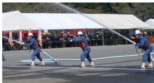
▲香我美消防団第1分団(ポンプ車)

今回、香我美消防団第1分団がポンプ車の部で 総合6位、香我美消防団第2分団が小型ポンプの 部で総合5位となり、両分団そろって入賞しまし た。