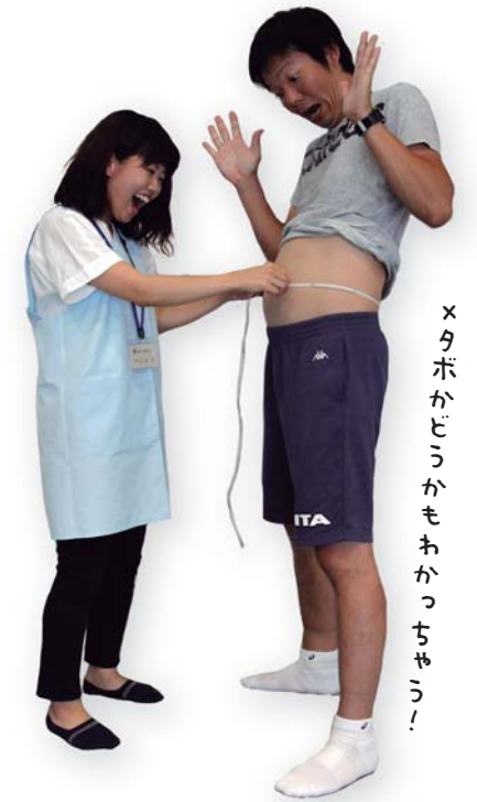
×タボかどうかもわかってちょう!

「去年も大丈夫だったから」「病院にかかっているから大丈夫」。そんなあなた、ちょっと待ってください! 生活習慣病をはじめとするさまざまな病気の多くは、自覚症状がなく進んでいきます。そしていつの間にか発症...、つらい闘病生活、かさむ治療費...。未然に防げたらいいですよね。 そのためにあるのが「健診」です。病気を早期に発見したり、症状そのものを未然に防いだりと良いことづくめ。自分自身の体のため、1年に1回「健診」を受けてください。