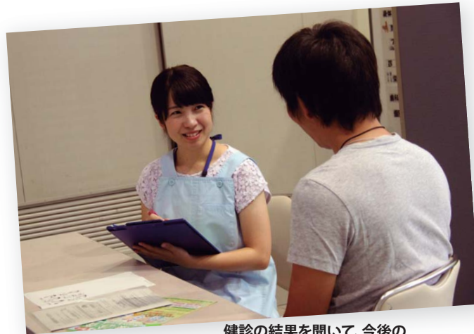
健診の結果を聞いて、今後の健康づくりに役立てよう!