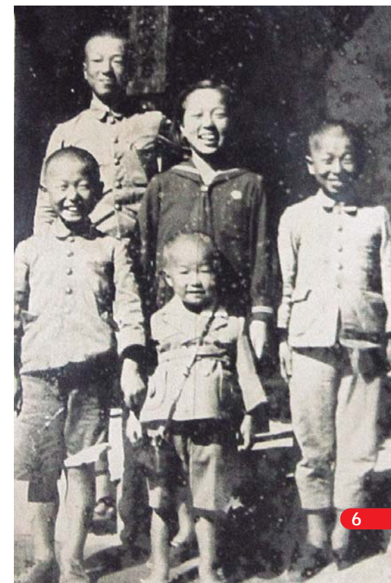
▼兄弟との写真「5人揃って写したのは最初で最後」と書き記されている

「今の時代は楽しいですよ、平和ですから。その分やれることがたくさんありますからね」と優しく笑う。これが元気の源なのか、彼女は今日も自然に囲まれた山里にある家への坂道を元気に上り下りしている。