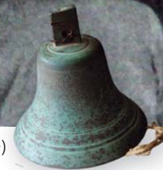
▶ 始業の鐘(所有:香南市文化財センター)