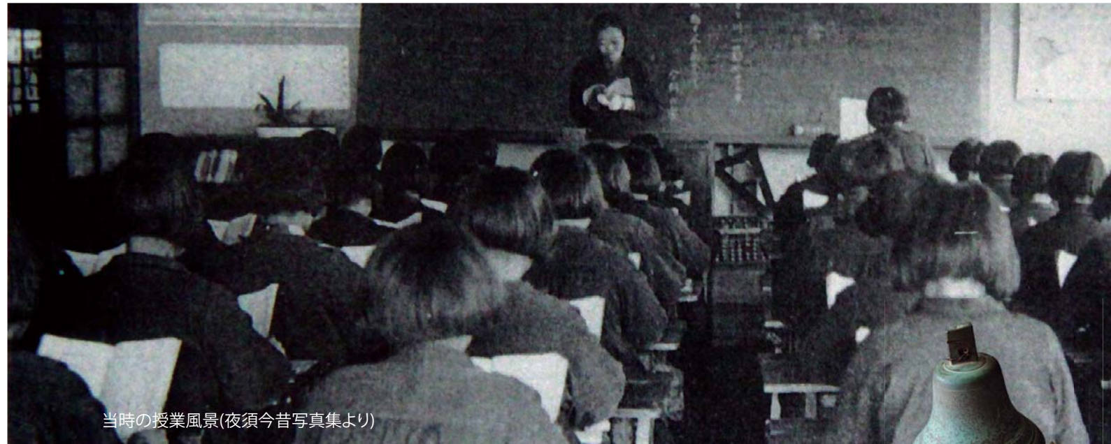
当時の授業風景(夜須今昔写真集より)

※事前打ち合わせは、お子さんと一緒をお願いします。 ※お子さんの預かりは、基本的に「まかせて会員」宅で行います。宿泊はできません。 ※万一の事故に備え、会員になると補償保険に加入します(保険料はセンターが負担します)。