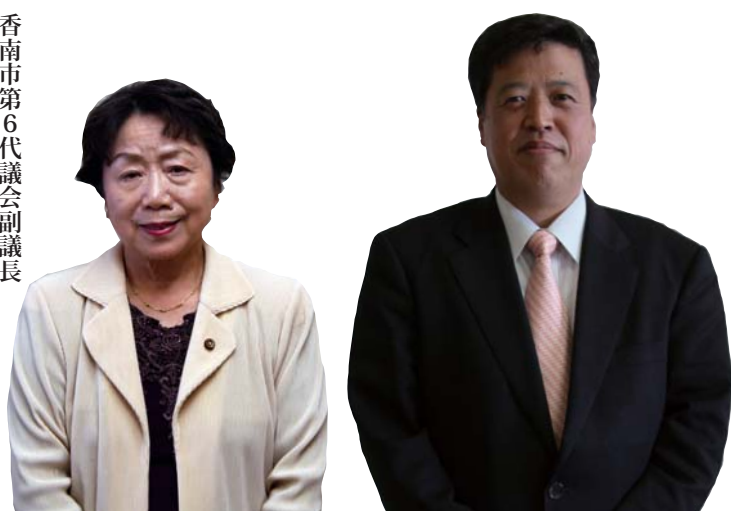
香南市第6代議会議長