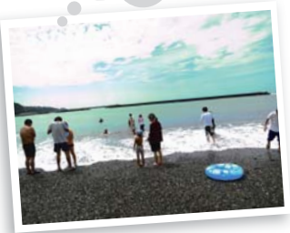
おでかけも あります!

「地域活動支援センターあけぼの」では、学校の長期の休みとなる期間、障害児をお預かりする事業を行っています。お子さんの安全に配慮し、体を動かして楽しめるプログラムを企画しています。