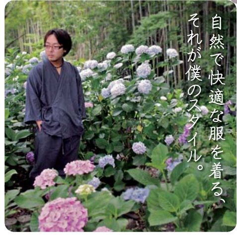
自然で快適な服を着る、それが僕のスタイル。