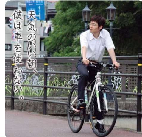
天気の良い朝、僕は車を使わない。