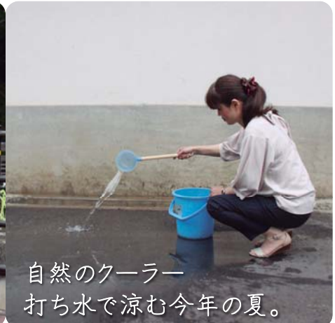
自然のクーラー 打ち水で涼む今年の夏。