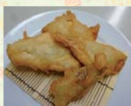
▲甘くてホクホク、いも天(100円)