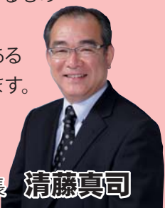
香南市長 清藤真司

「香南市ふるさと応援寄附金」は、市政運営の財源である税収が減少している中において重要な収入となっています。これからも多くの人に香南市の魅力を知ってもらえるよう情報発信していくとともに、「香南市ふるさと応援寄附金」の増額を目指し取り組んでまいります。