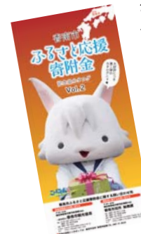
新しくなった 記念品カタログ

ふるさと納税とは? 生まれ育ったまちを出た人がふるさとや、自分の意思で応援したい自治体へ寄付をすることです。寄付をすると税金が控除され、寄附をした自治体から記念品が贈られてきます(一部お礼のない場合もあります)。 全国的には、昨年、約72万人が利用しており、約1,653億円のお金が動いています。都会から地方にお金が動くことにより、地域が活性化し、地方が元気になる政策なのです。 自治体は寄附金で新規事業や事業拡大ができるようになります。記念品を扱う事業者・生産者は販路が広がり、新商品などの開発に力を注げます。 住民は寄附金の恩恵を受け、生活の向上を図ることができます。