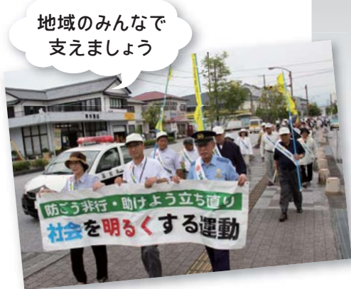
地域みんなで 支えましょう

「社会を明るくする運動」は、すべての国民が、犯罪や非行の防止と罪を犯した人たちの改善更生について理解を深め、それぞれの立場において力を合わせ、犯罪や非行のない地域社会を築こうとする全国的な運動です。