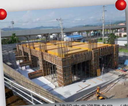
▲建設中の避難タワー(赤岡町)

工事期間中、皆さんにはご迷惑をおかけいたしますが、安全に配慮し進めていきますので、ご協力をよろしくお願いいたします。なお、残る10基は早期に着工できるように進めています。