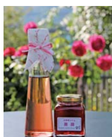
※使用するバラの種類により色が異なります。ご了承ください