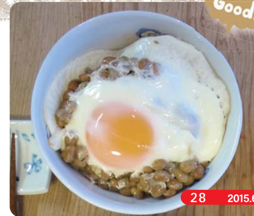
※レシピ集作成時(平成25年度)に掲載しています

◎焼くと納豆のネバネバがなくなって、ネバネバが苦手な人も食べやすいです。 ◎納豆にタレを混ぜて焼くと焦げやすいので、混ぜずに焼きましょう。