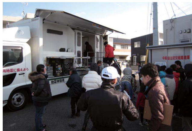
▲起震車で地震体験をする自主防災組織